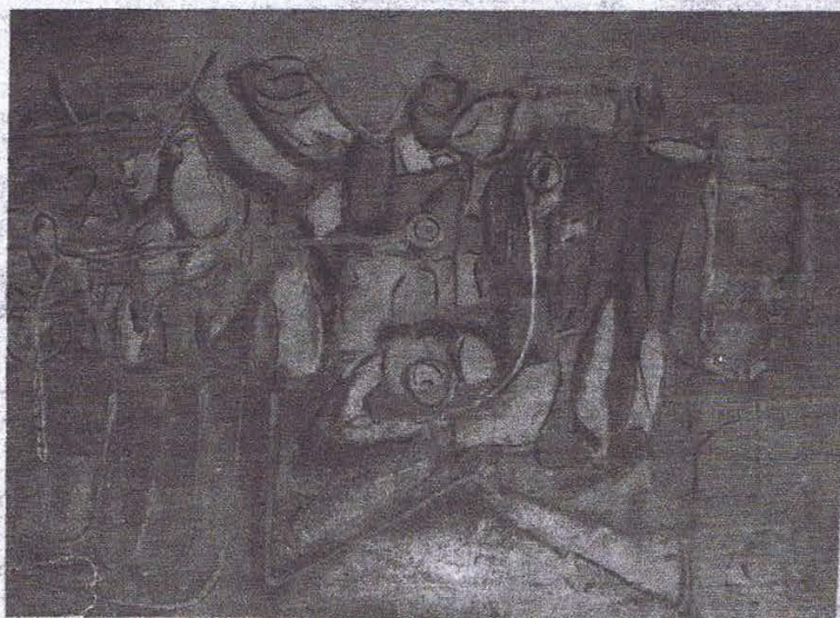
«Chorégraphie», huile de l'artiste.

Déroutant, l'artiste. Sans conteste. Témoignant d'un éclectisme qui, loin de s'éparpiller aux quatre vents de l'insipide, compose pièce par pièce le puzzle de son imagination et de sa personnalité. On sent l'homme libre de toutes entraves, jetant d'un trait spontané sur la toile les images qui le traversent, les messages qui l'habitent. L'huile ressemble à l'aquarelle, la gouache n'a pas l'air d'une gouache, qu'importe; par la multiplicité des signes plastiques, par une parfaite maîtrise de la couleur, Ali Lagrouni invite au voyage. Sans retenue. Le regard tendu, nostalgique, vers le bleu profond de son ciel natal (célèbre «Bleu de Fès»). Le rappel mordoré et chaud des tapis d'Orient («Sourate»). La plénitude paisible et ensoleillée des villages de sable («Dar»).