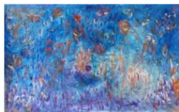
17 - ALI LAGROUNI - Oceanic - Oil on canvas - 90 x 128cm - 2015