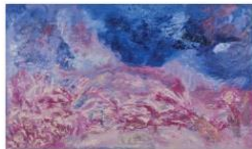
14 - ALI LAGROUNI - Complementarity - Oil on Canvas - 130 x 194cm - 2012