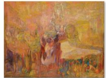
03 - ALI LAGROUNI - Welcoming - Oil on Canvas - 200 x 300cm - 1991