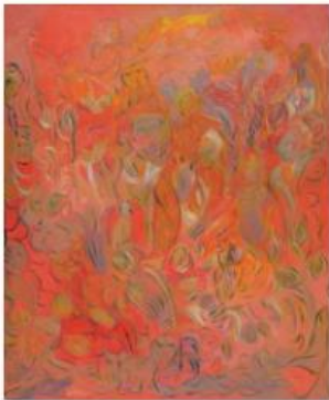
10 - ALI LAGROUNI - Body, Soul and Spirit - Oil on Canvas - 120 x 100cm - 2011