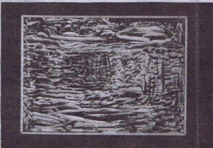
• Deux toiles de A. Lagrouni

R. : Il y a d'abord l'eau sous forme de pluie, nuage, neige... Il y a le bleu — bleu de Fès notamment, dont on se sert pour décorer certains instruments de musique, la darbouka, la tairija — J'ai aussi travaillé sur les couleurs chaudes pour symboliser des habits de femmes de chez nous, la saison de l'été, les moissons. J'ai peint la ville, en focalisant certains aspects urbains: la medersa Al Karaouiyne, le m'sid, la médina,