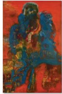
09 - ALI LAGROUNI - Touareg - Oil on Canvas - 250 x 160cm - 2005