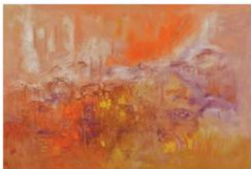
16 - ALI LAGROUNI - Light of Morocco - Oil on Canvas - 129 x 195cm - 2012