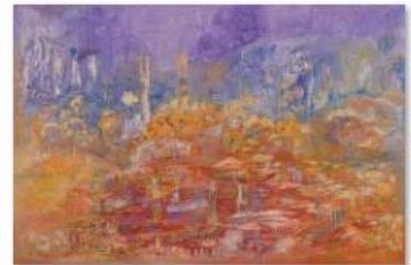
12 - ALI LAGROUNI - Renaissance - Oil on Canvas - 130 x 194cm - 2012