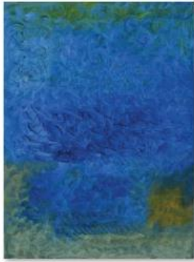
07 - ALI LAGROUNI - Depth - Oil on Canvas - 80 x 59cm - 2005