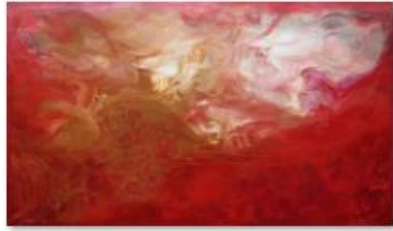
19 - Ange d'Amour - Oil on canvas - 160 x 120cm - 2015