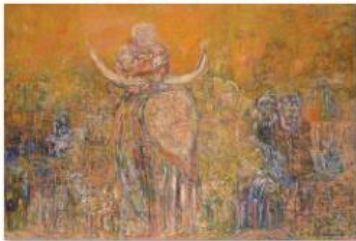
01 - ALI LAGROUNI - Hinde - Oil on Canvas - 200 x 300cm - 1991