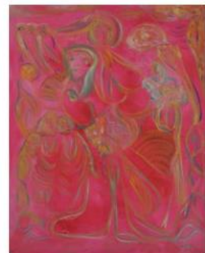
15 - ALI LAGROUNI - Duality - Oil on Canvas - 100 x 80cm - 2012