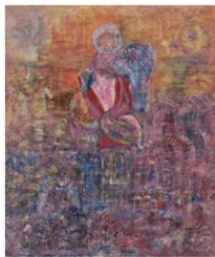
05 - ALI LAGROUNI - Root - Oil on Canvas - 80 x 60cm - 2001