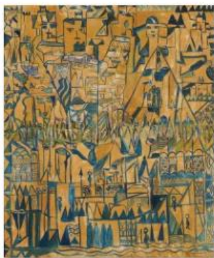
04 - ALI LAGROUNI - Egyptology - Oil on Canvas - 120 x 100cm - 1996