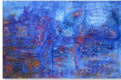
20 - ALI LAGROUNI - The Great Blue - Oil on canvas - 200 x 300cm - 2017