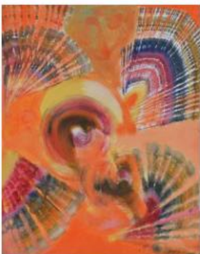
13 - ALI LAGROUNI - African Dance - Oil on Canvas - 50 x 40cm - 2012