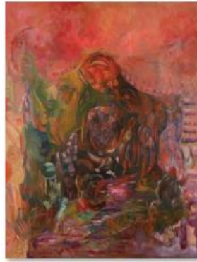
08 - ALI LAGROUNI - Supreme Protection - Oil on Canvas - 260 x 200cm - 2005