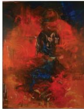
02 - ALI LAGROUNI - Passion - Oil on Canvas - 280 X 200cm - 1991