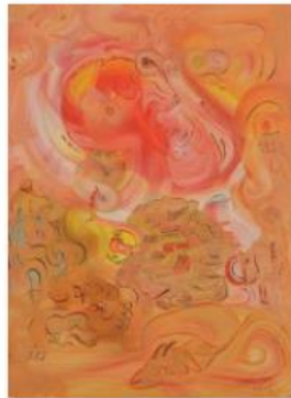
11 - ALI LAGROUNI - Composition - Oil on Canvas - 107 x 80cm - 2011