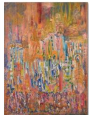
06 - ALI LAGROUNI - Festival of Joy - Oil on Canvas - 200 x 150cm - 2002